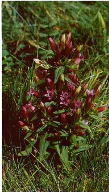
Gentian, pour redonner courage et confiance.

L'énergétique chinoise présente de grands avantages. Le premier est de mettre en relation les organes avec des trajets énergétiques (les « méridiens ») à la surface du corps, d'où la possibilité d'agir sur les organes à distance, par pression ou poncture sur des points judicieusement choisis. Le second, qui nous intéresse plus particulièrement ici, est d'attribuer à chaque organe, en plus de son rôle