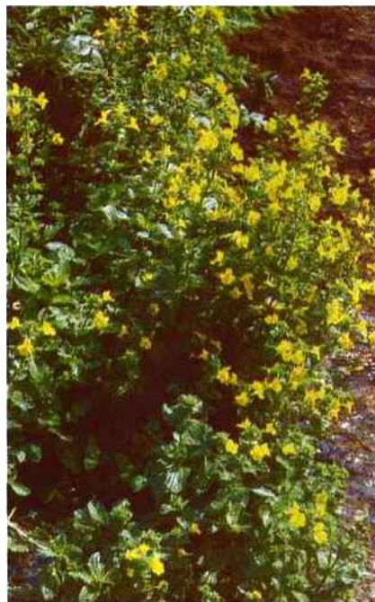
Mimulus pour les peurs bien identifiées.

Nous nous sommes tous amusés à « faire chanter un verre » en frottant doucement sur son bord un doigt légèrement