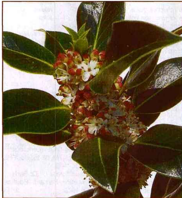
Holly, le houx, permet de lâcher un peu de pression en cas de colère excessive.

Mais, tout comme la peur, elle peut devenir une habitude, intervenir hors de propos et de façon disproportionnée. Le