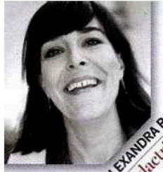
PAR ALEXANDRA RAILLAN rédactrice en chef beauté